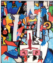
»Lutherzyklus« 10 Druckgrafiken von Otmar Alt, zzgl. Titelblatt